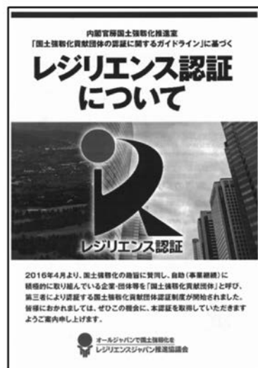
レジリエンス認証パンフレット