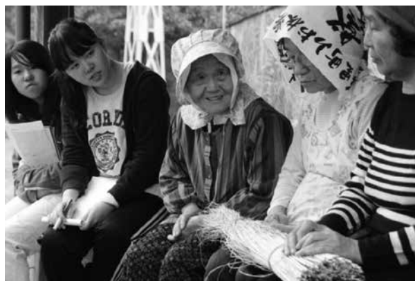
生徒による調査風景

納豆文化は、指定文化財とは違い、保存の対象になったことはない。地域の人たちにとっては、ありふれた生活の一部でしかないのである。しかし、聞き取りに付き合ってくれた人たちは、納豆のことを聞くと、とても嬉しそうに話してくださつた。納豆は他の文化財に引けをとることはないほどの存在感を持っていることが伝わってきた。生き活きと納豆のことを語るおばあさんを見た家族が、普段見せることのない表情だと驚くこともあつた。おばあさんの実家で納豆を作って食べていたのに、嫁ぎ先では納豆を食べることはなく、納豆の話をするこもなく過ごしていたのだろう。そこに高校生が納豆に興味を持ってくれ、うれしかったのかもしれない。