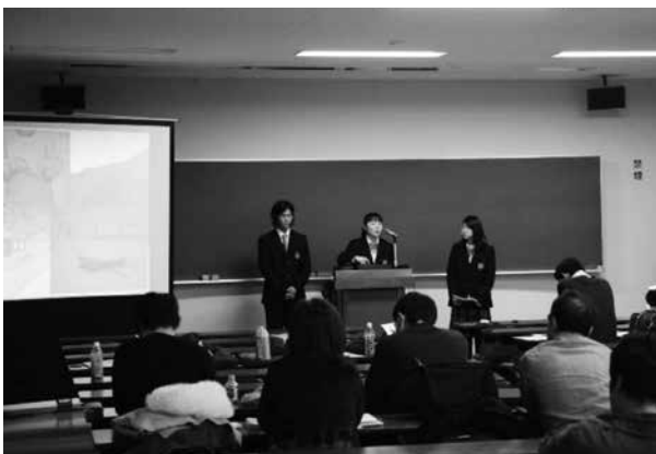
高野山大学での発表の様子

最初の外部発信の機会は、2014年12月14日に高野山大学で開催された高野文化圏研究会シンポジウムでの発表であった。高校生が調査した納豆文化とともに、りらの教育活動について報告をした。翌年の3月にはその内容をもとに「真国川流域の納豆文化」という論文を高校生とともに寄稿した。真国川流域の納豆の学術的な記録となっている。それ以降も、ラジオやテレビ、新聞などのマスコミで納豆文化のことが取り上げられることとなった。和歌山に納豆文化があったという貴重性とともに、それを高校生が発見して、研究者にも劣らない調査をして報告したという事実が、マスコミに興味を持ってもらったのである。